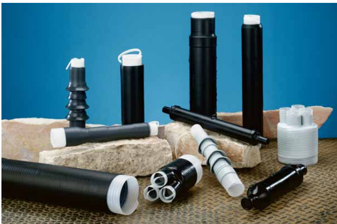
Za studena smršťované výrobky