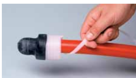
Ukončovací čepičky EC