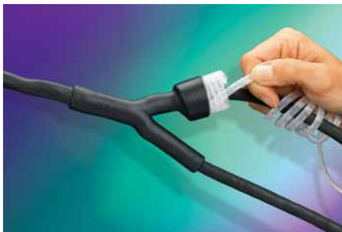
Za studena smršťované trubice – je možno dodat i ve speciálních tvarech