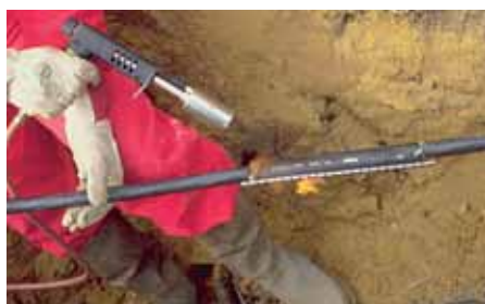
Opravné manžety HDCW