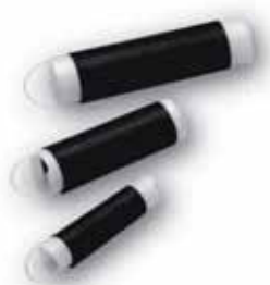
PST větších rozměrů