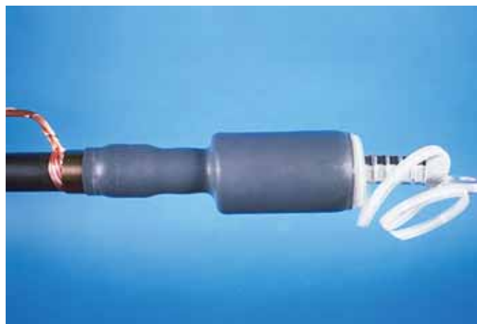
Technologie smršťování za studena se často využívá ve VN aplikacích