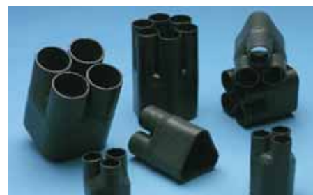
Rozdělovací hlavy SKE